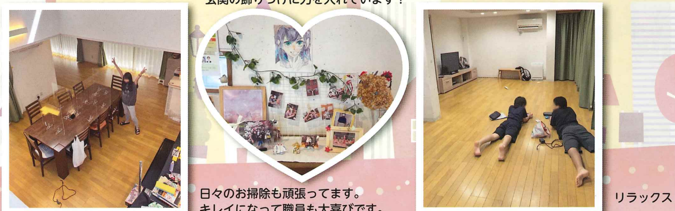
玄関の飾りつけに力を入れています! 日々のお掃除も頑張ってます。キレイになって職員も大喜びです。 リラックス