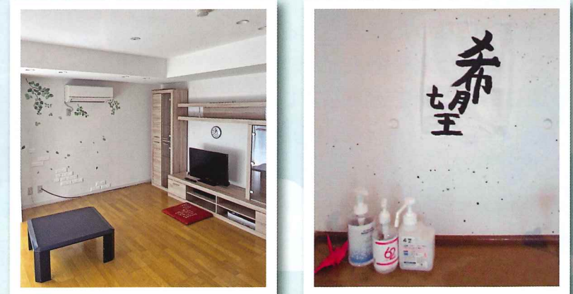
綺麗なお部屋 手洗い消毒は欠かせないね

希望棟ってこんなところ→小学4年生から、高校3年生まで生活しています。リビングで、工作したり、ゲームやテレビを観て楽しく生活しています。