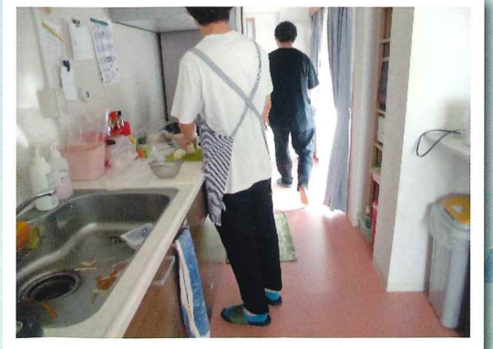
料理のお手伝いかな?