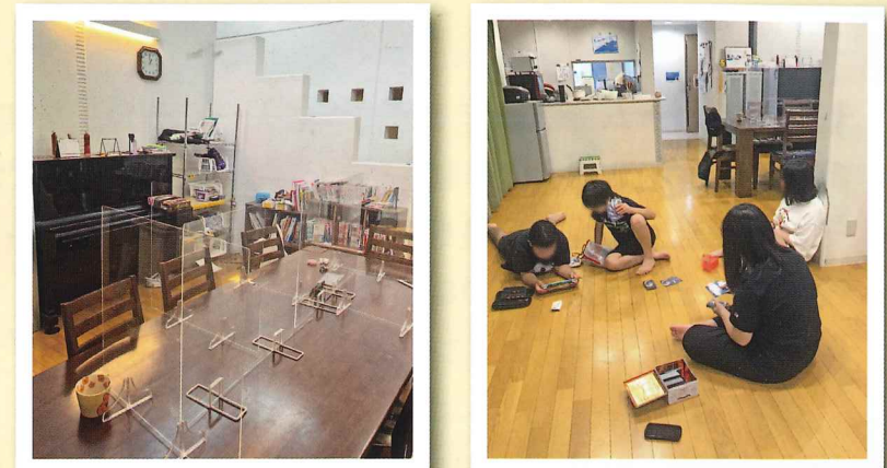
感染対策もバッチシ! みんなで団らん

小学生から高校生まで生活している棟です。食卓は宿題や勉強する時にも使ってます。自室にも机はあるけれど、難しい勉強もみんな一緒なら頑張れる!食後はテレビ前で好きなゲームを楽しみます。