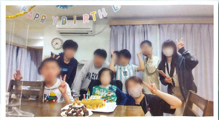
誕生日会もみんなでお祝いしています!