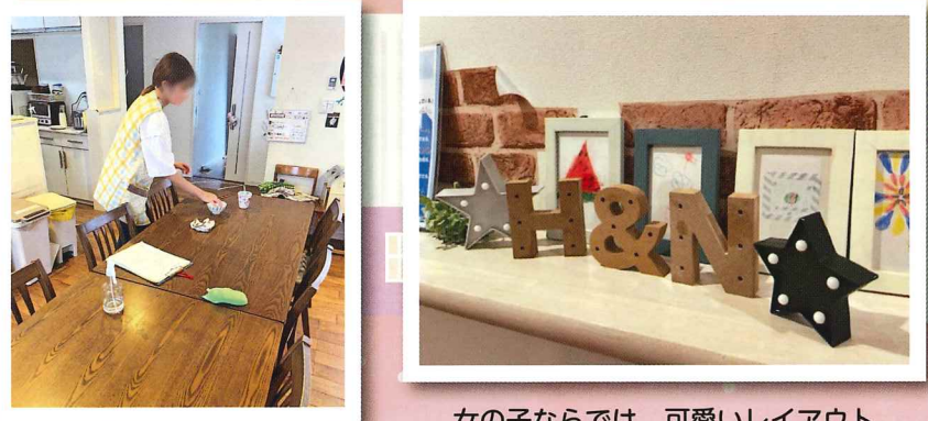
女の子ならではの、可愛いレイアウト