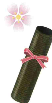
いざ、旅立ちのとき。たくさんの思い出を胸に、大きく羽ばたけ!!