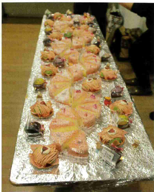
愛情込めた桜色のケーキ！給食職員が手作りしました。