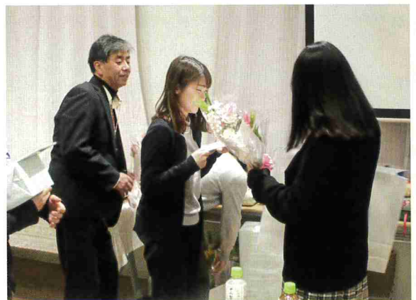
職員からの熱い激励メッセージ。時には笑いあり…涙あり!!

毎年行われている卒業を祝う会です。中学 3 年生は 3 人。高校 3 年生はヨゼフホーム歴代の中で一番多く 9 人です。子どもも職員も、受験や進路について、大いに悩みに悩みました。葛藤や奮闘をしたからこそ、皆それぞれの進路を決定することができました。卒業を祝う会では、子どもたちは進路報告をします。卒業生は、担当職員からの激励メッセージをもらいます。今ではもう時効となった? 思い出話も飛び出ることもありました。