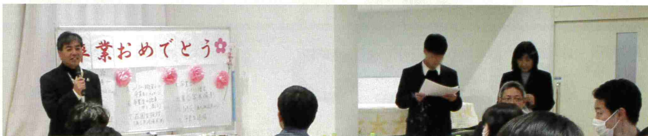
来年卒園生になる子が司会役を担ってくれます。とても頼もしいです。