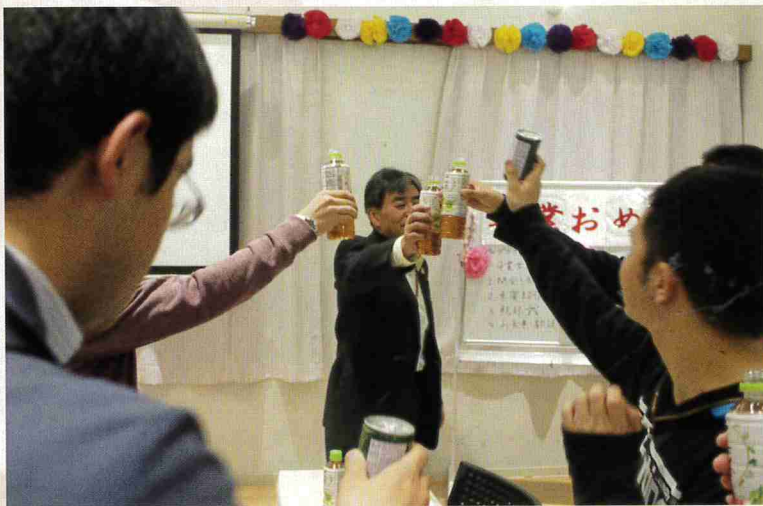
前途を祝って干杯ーい!!! 二十歳になったら…お酒で乾杯したいな! それまでおあずけです。