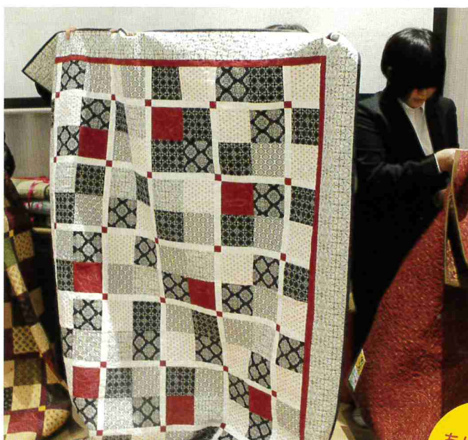
キルトで作られたラグマットをいただきました。みんなそれぞれに合わせたカラー、一針一針丁寧に作られています。ステッピングストーンズさんありがとうございます！